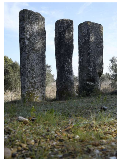
Les bornes de César à Beaucaire

A la suite de cette présentation, un point sera fait avec les différentes collectivités et l'entreprise pour définir les modalités de mise en