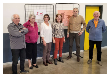
Les membres du conseil d'administration de l'association Via Domitia