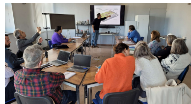
Présentation des propositions par le bureau d'étude ILYA

Cette présentation fait suite à une première restitution faite le 24 juillet 2024 sur les éléments de diagnostic du site :