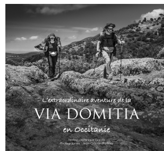
Le livre sur la Via Domitia disponible en librairies