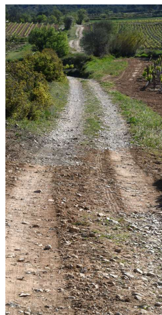
Le tracé de la voie à la hauteur de Pinet -34-

La Via Domitia le plus imposant monument antique d'Occitanie