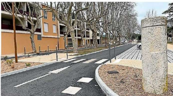
La pierre témoin de la Via Domitia, sur l'avenue de la Vaunage.

Le conseil municipal s'est réuni ce mardi 25 mars, à 19 heures, à l'hôtel de ville en présence de